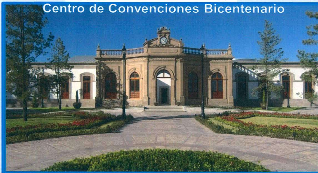
Centro de Convenciones Bicentenario

DIRECCIÓN MUNICIPAL DE ADMINISTRACIÓN Y FINANZAS Gobierno Municipal de Durango