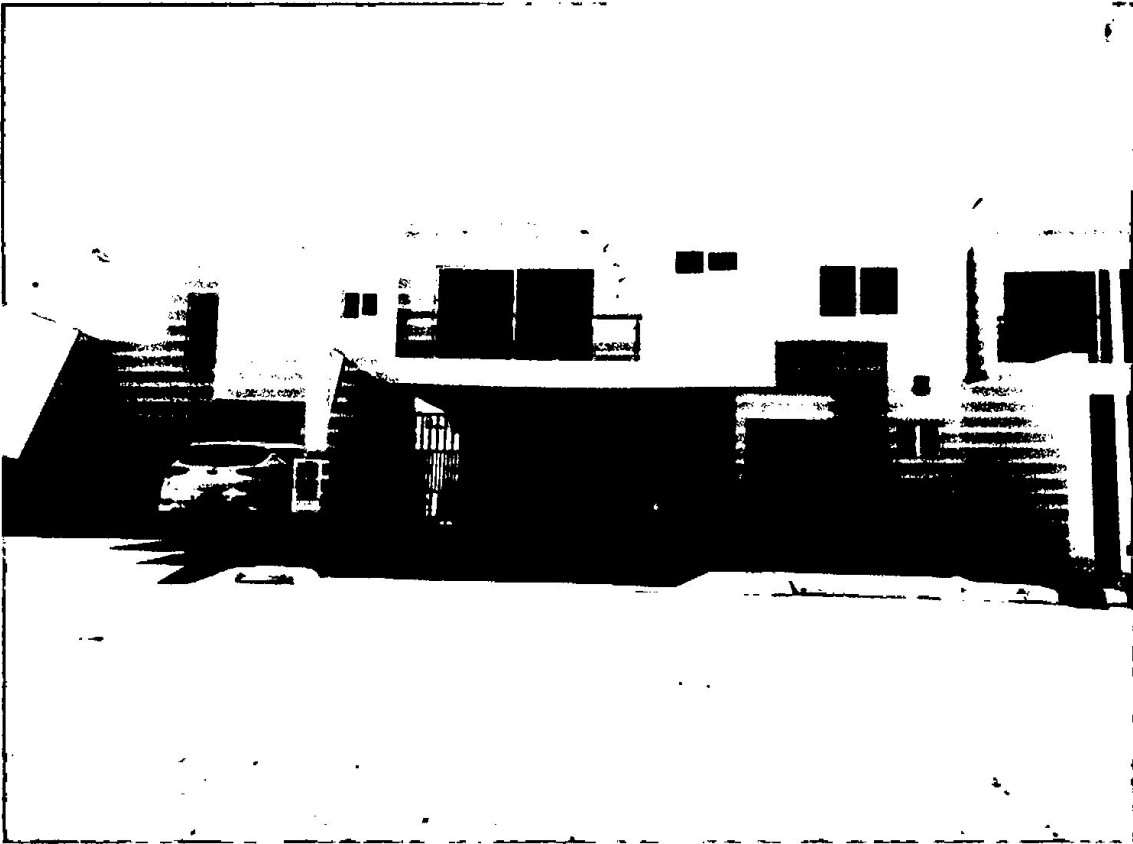
FACHADA ESTADO ACTUAL